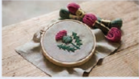
樋口 愉美子 ウールステッチキット 2,400円