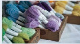
appletorns 3束セット 540円

ほかにも、DMCのウール刺繍糸をはじめ、可愛い裁縫道具の販売、オートクチュール刺繍のご紹介など、刺繍好きにはたまらないグッズがいっぱいあります。