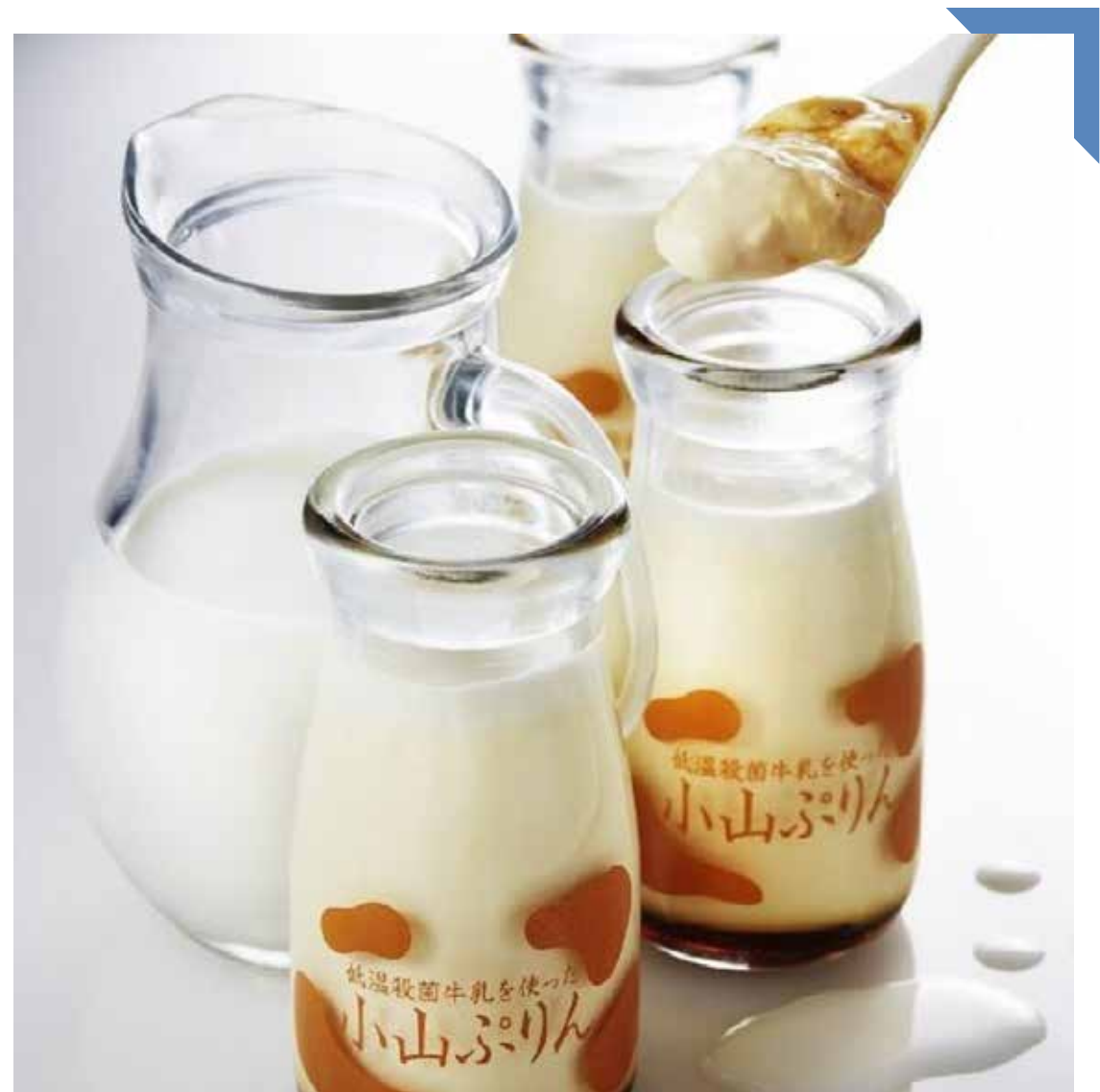
8.16 [金] パティシエ エス コヤマ ◆ 小山ぶりん (4個入) ..... 1,598円