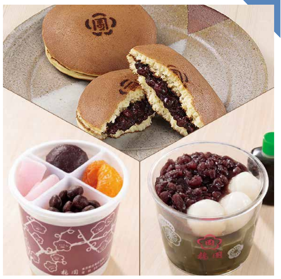
8月 梅園 毎週【木】 ◆ どら焼 (1個) ..... 324円 ◆ あんみつ (1個) ..... 594円 ◆ 抹茶あんみつ (1個) ..... 594円