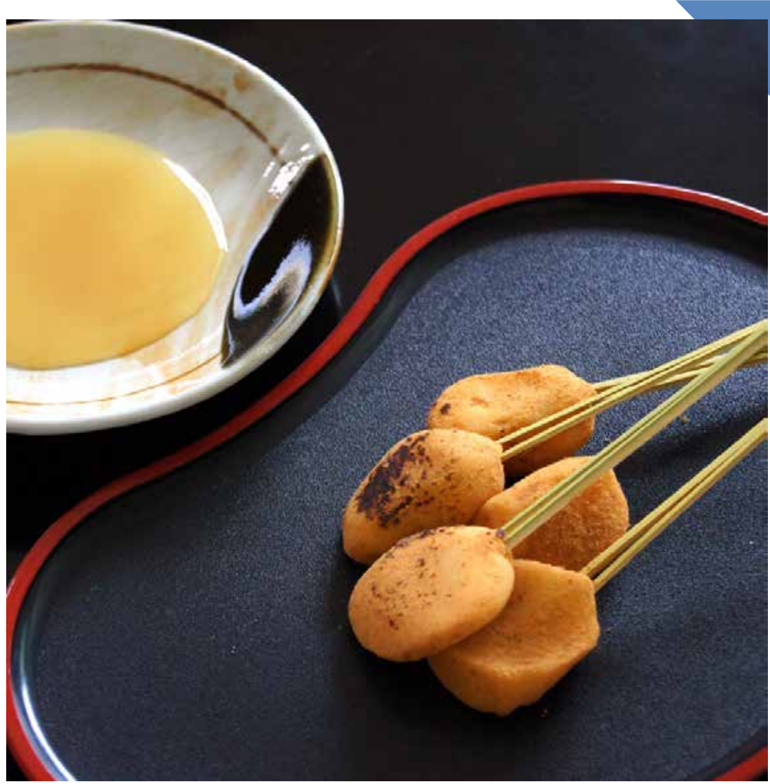
8.21 [水] 七條甘春堂 ◆ 京炙りもち「やすい」 (8本入) ..... 864円