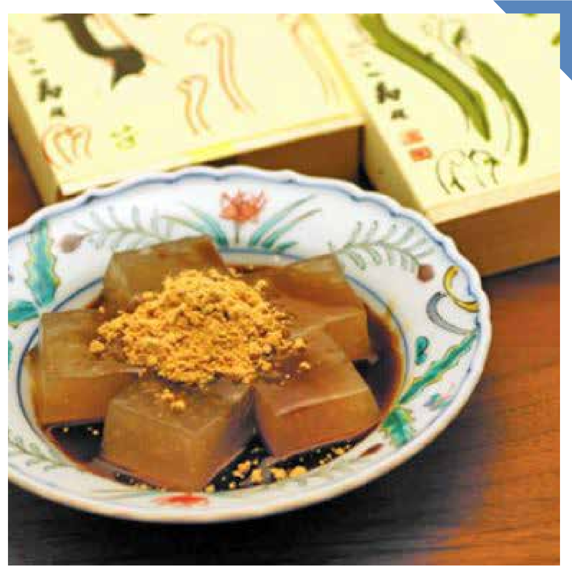
8.23 [金] 鎌倉 こ寿々 ◆ わらび餅 (小) (9切入) ..... 972円