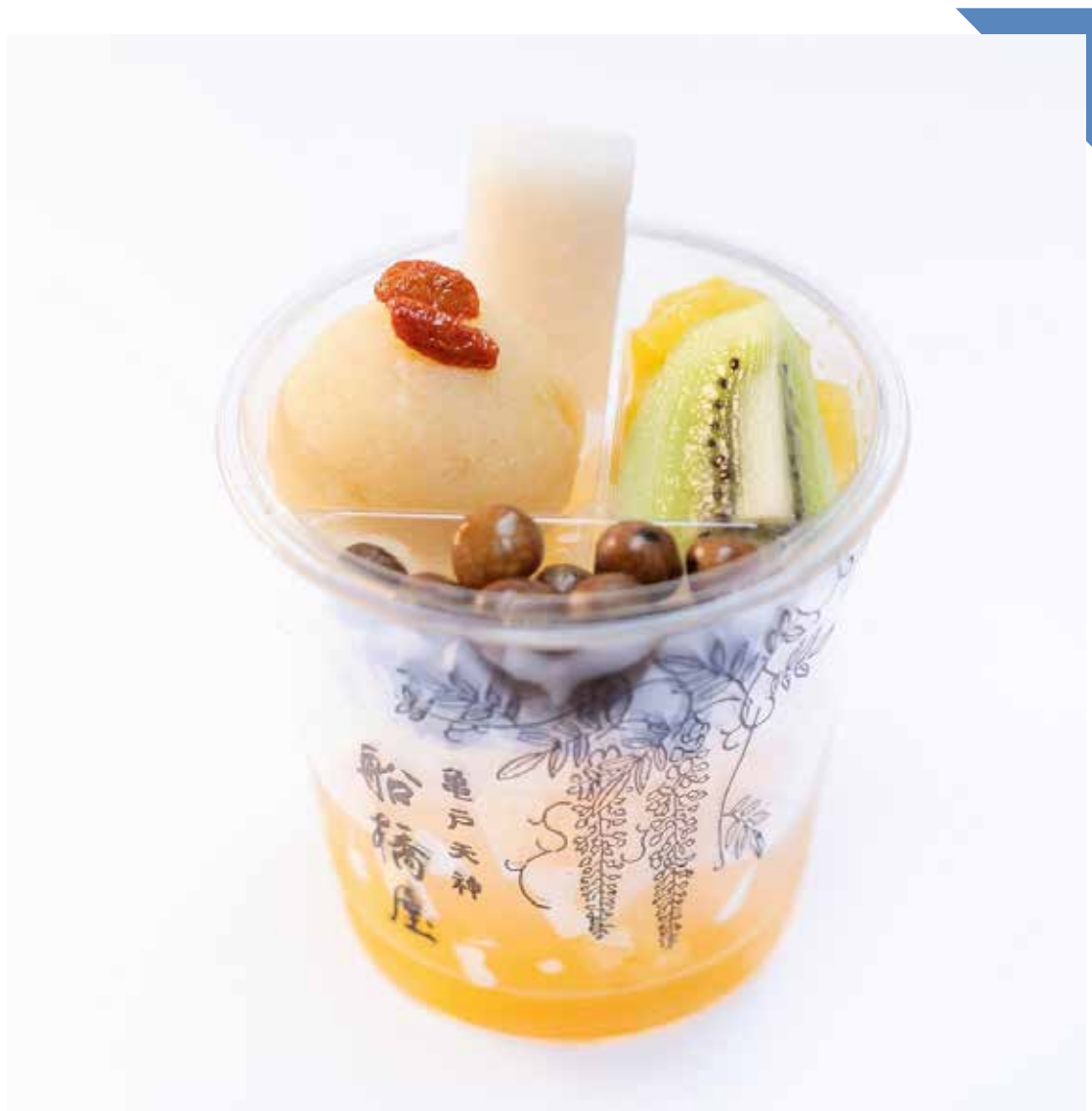
8.18 [日] 船橋屋 ◆ 夏の柑橘フルーツあんみつ (1個) ..... 690円