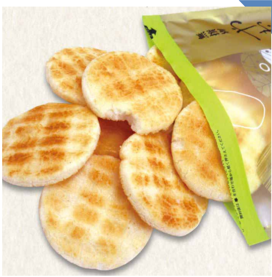
8.22 [木] えくぼ屋 ◆ 無撰別 各種 (1袋) ..... 各270円 ※なくなり次第終了。