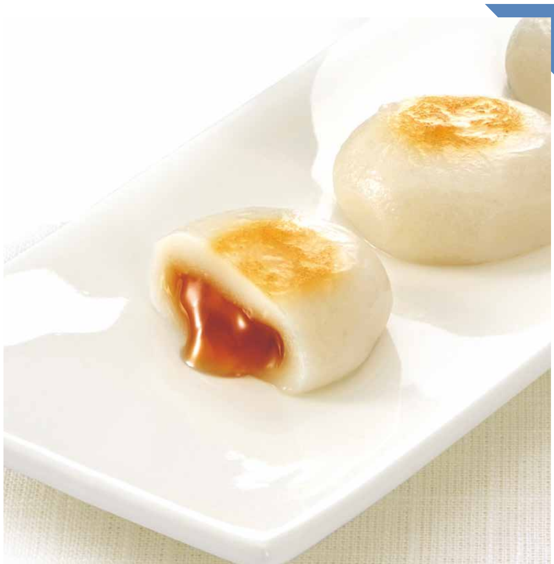
8.14 [水] 寛永堂 ◆ まろのおみた (12個入) ..... 751円