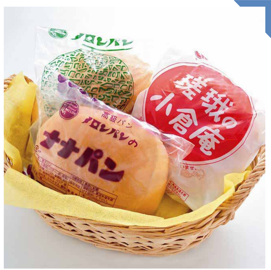
8.22 [木] メロンパン ◆ メロンパン (1個) ..... 240円 ◆ ナナパン (1個) ..... 230円 午後3時から ◆ 嵯峨の小倉庵 (1個) ..... 320円