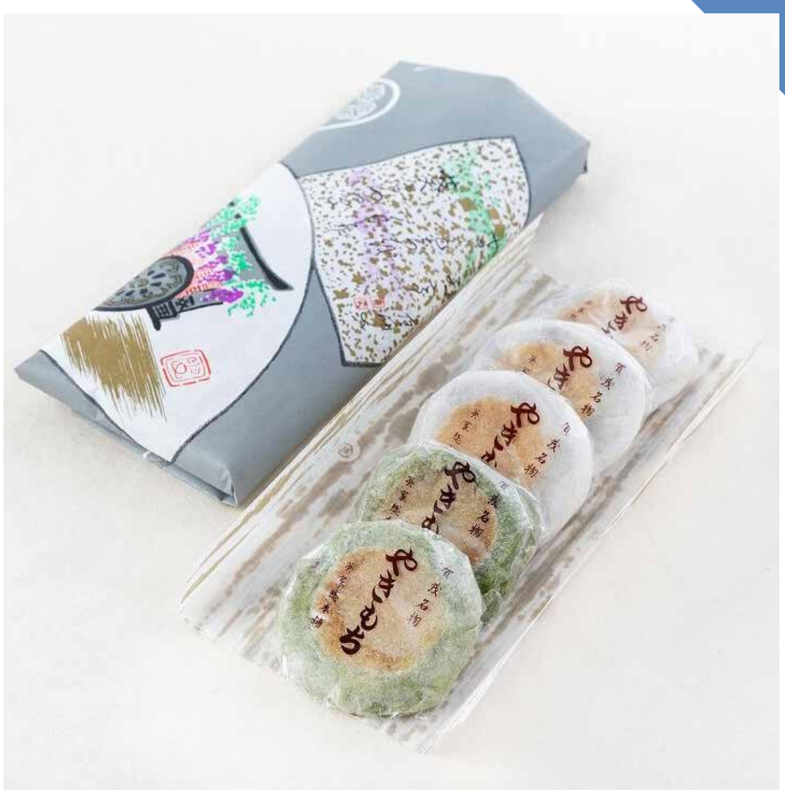
8.28 [水] 葵家やきもち総本舗 ◆ やきもち (1包/白3個・よもぎ2個入) ..... 675円