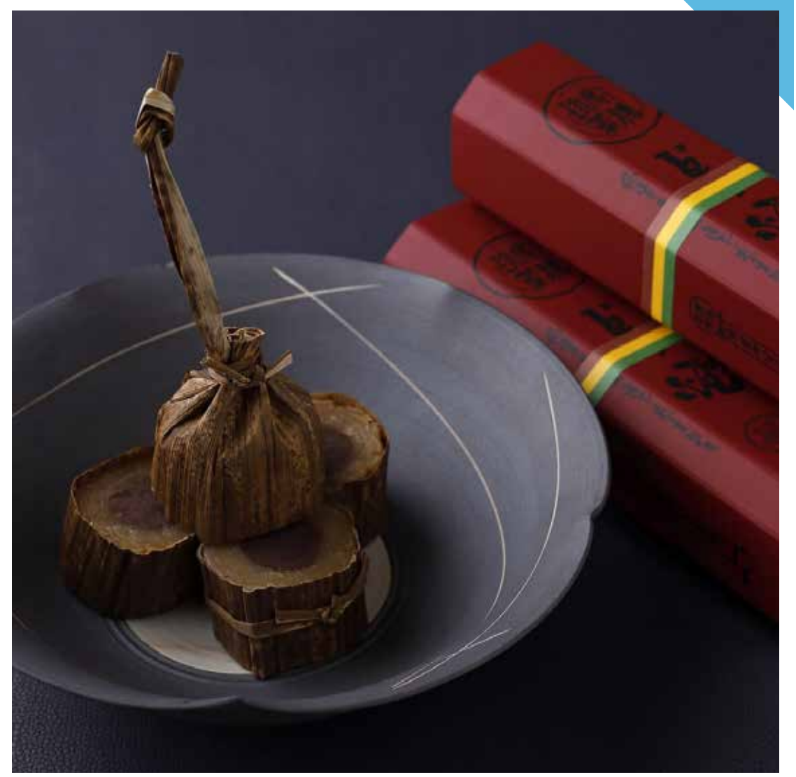
7.20 [土] 笹屋伊織 ◆代表銘菓 だら焼 (1棹) .....1,944円【限定10棹】