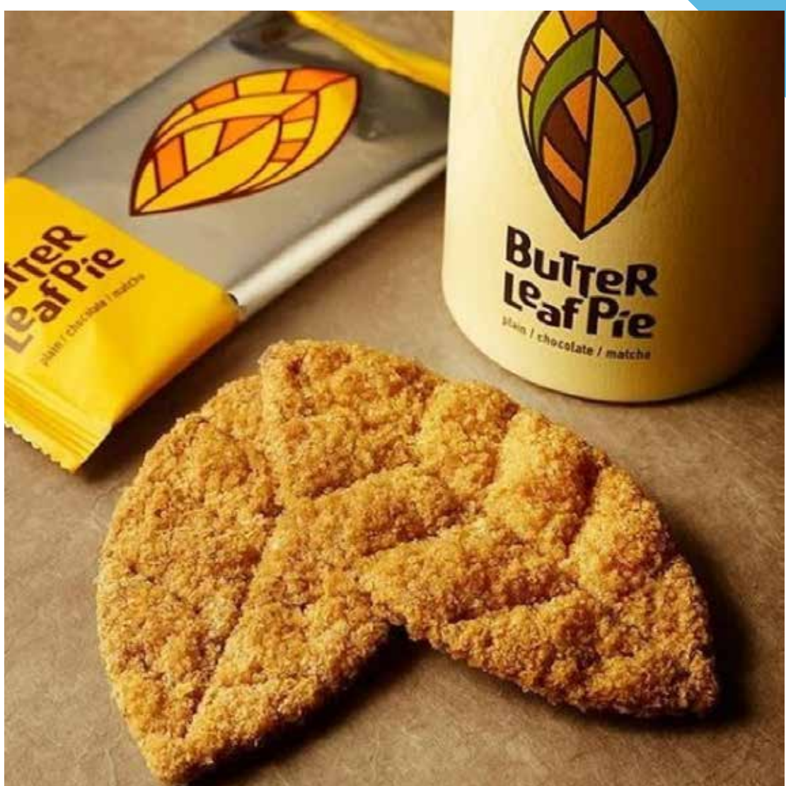
7.19 [金] パティシエ エス コヤマ ◆バターリーフパイ(プレーン) (3枚入) .....1,080円