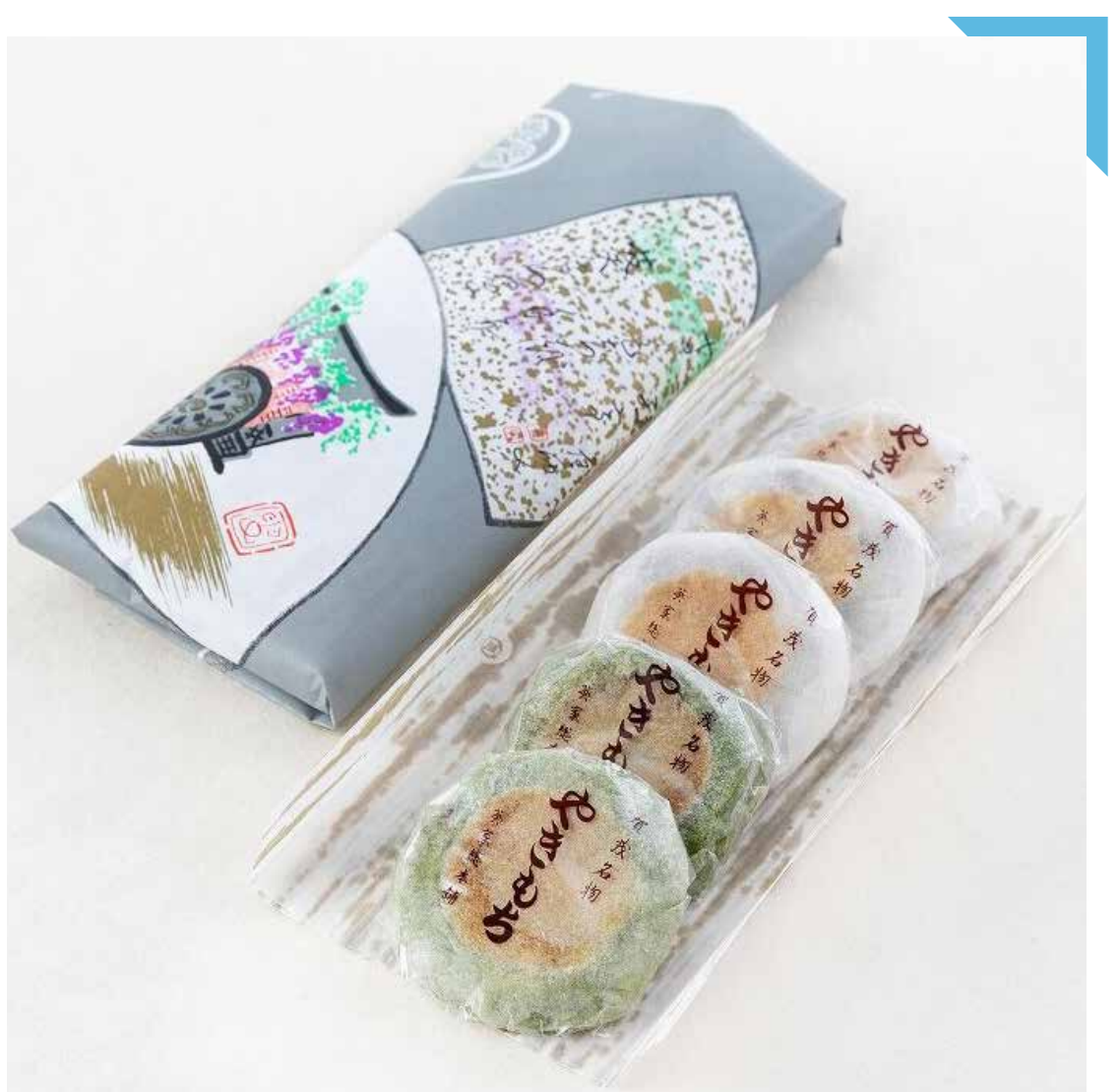
7.31 [水] 葵家やきもち総本舗 ◆やきもち (1包/白3個・よもぎ2個入) ..... 675円