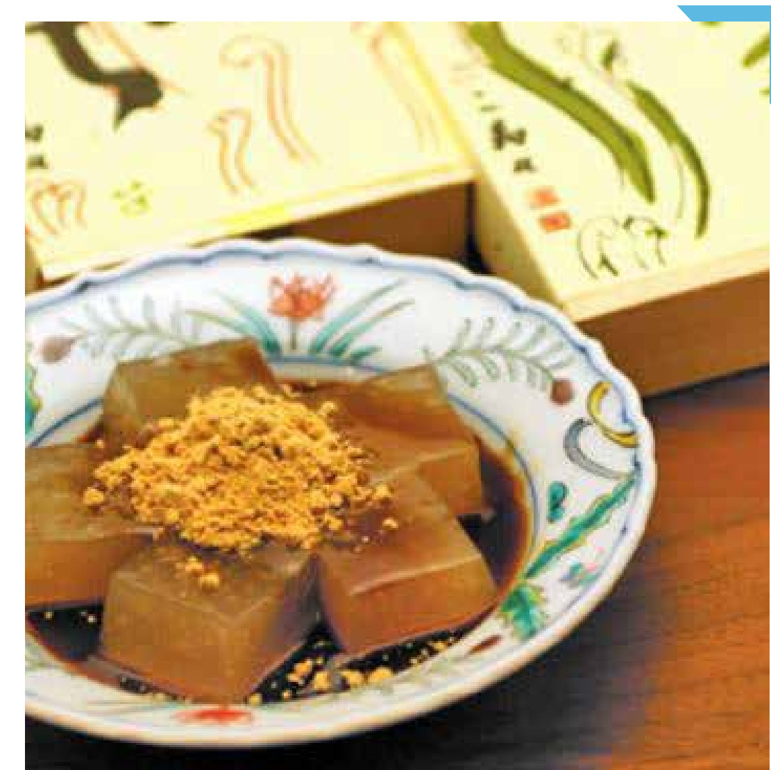
7.26 [金] 鎌倉 こ寿々 ◆わらび餅(小) (9切入) .....972円