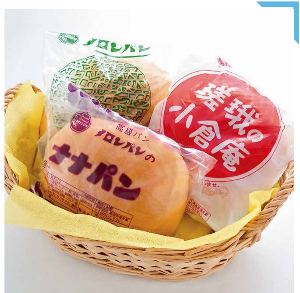
7.25 [木] メロンパン ◆メロンパン(1個) ..... 240円 ◆ナナパン(1個) ..... 230円 ◆嵯峨の小倉庵(1個) .....320円