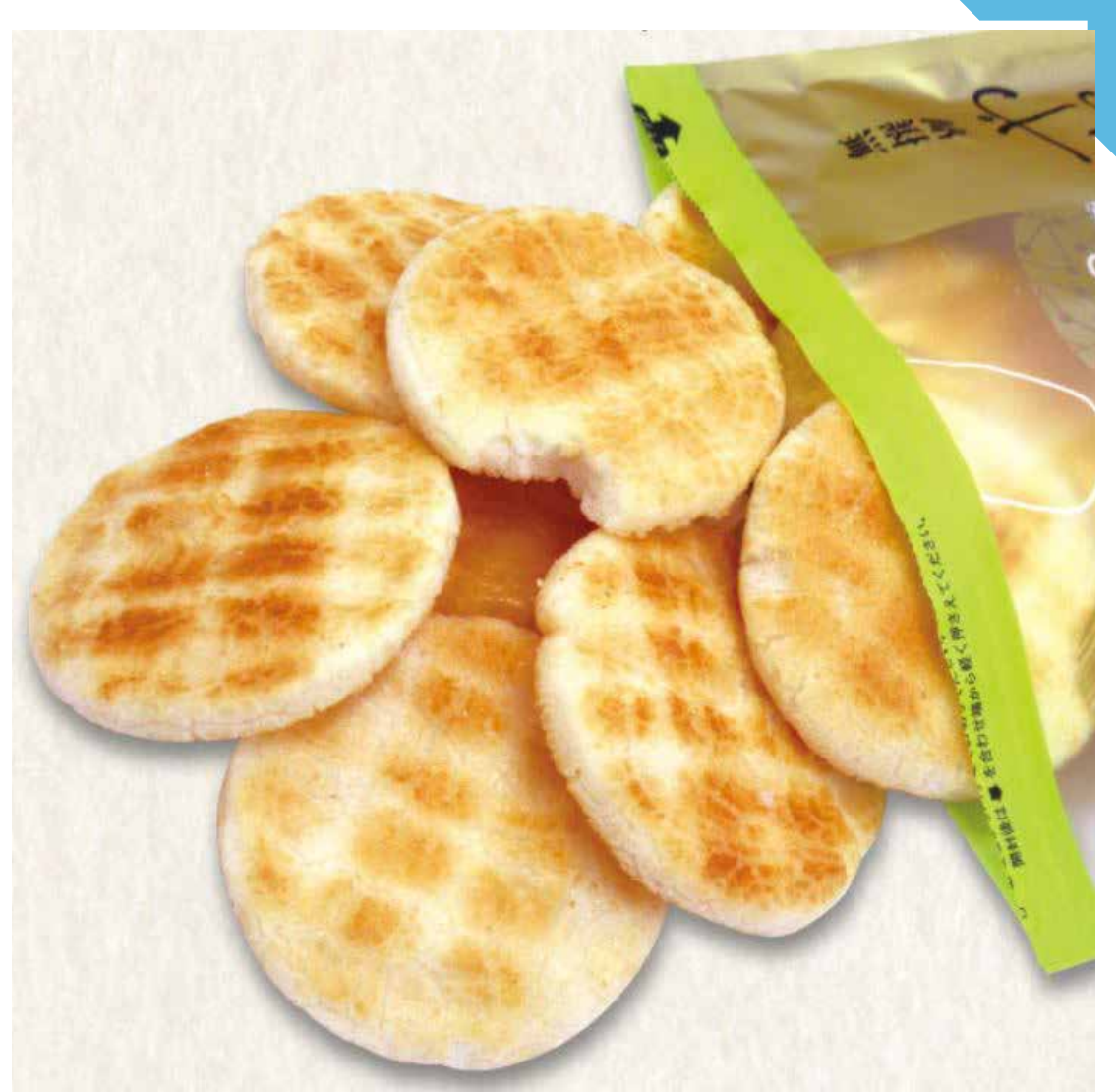
7.23 [火] 31 [水] えくぼ屋 ◆無撰別 各種 (1袋) ..... 各270円 ※なくなり次第終了。