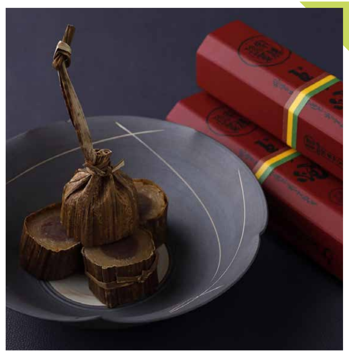
5.20 笹屋伊織 ◆ 代表銘菓 だら焼 (1棹) ……………1,944円【各日限定10棹】 [月]