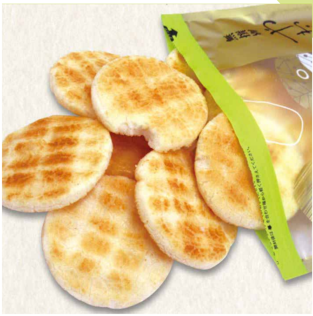
5.21 えくぼ屋 ◆ 無撰別 各種 (1袋) ……………各270円 ※なくなり次第終了。 [火] 31 [金]