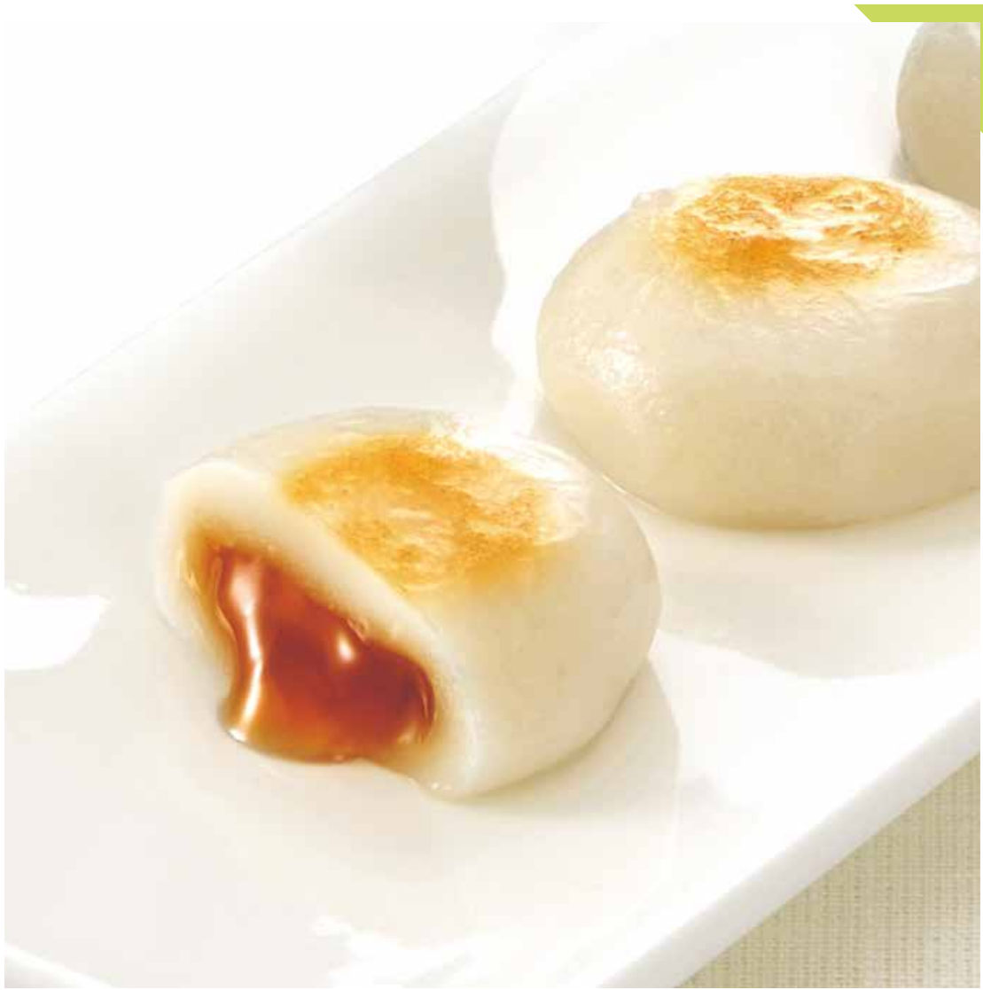
5.15 寛永堂 ◆ まろのおみた (12個入) ……………751円 [水]