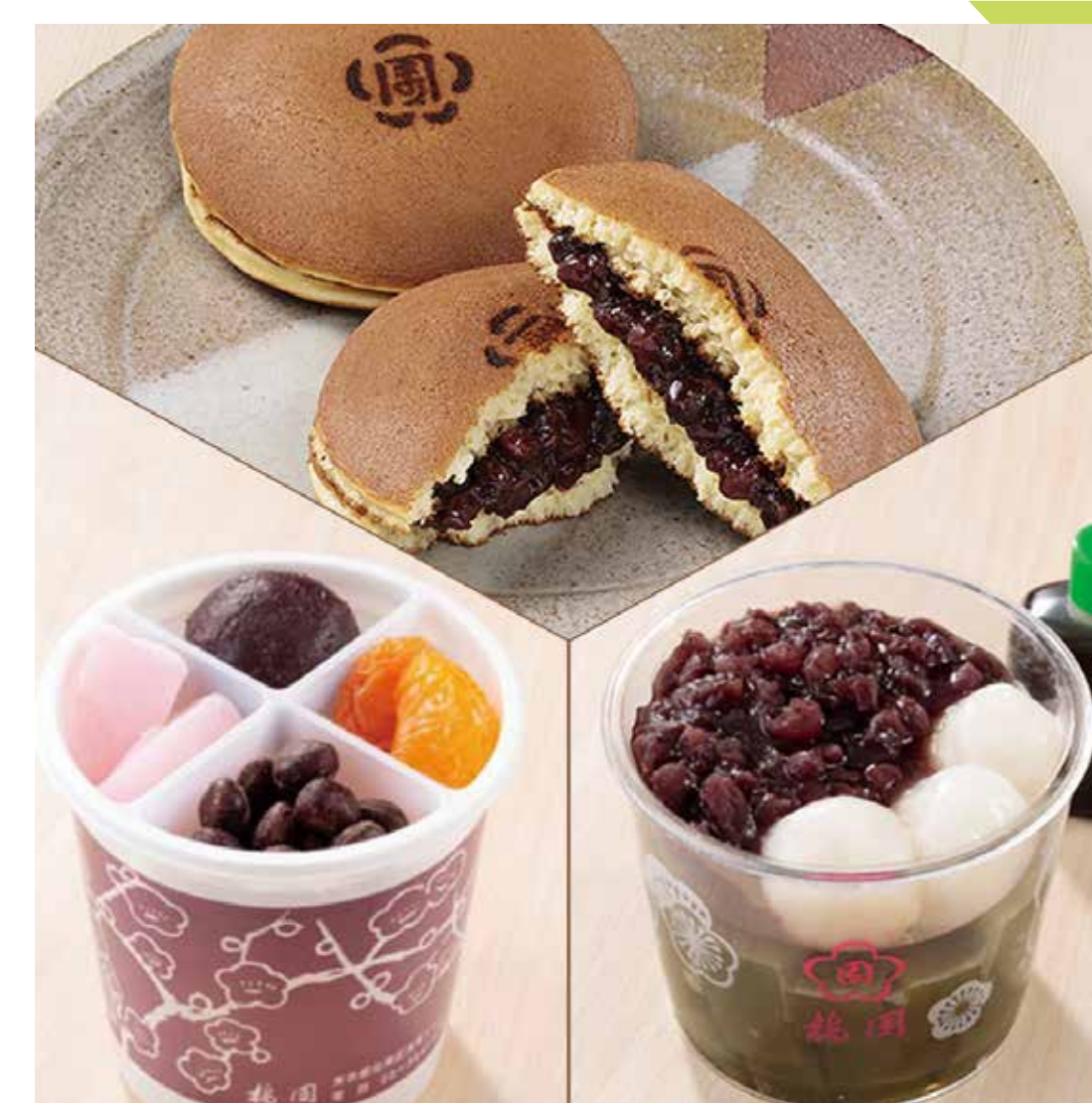
5月 梅園 ◆ だら焼 (1個) ……………324円 ◆ あんみつ (1個) ……………594円 ◆ 抹茶あんみつ (1個) ……………594円 毎週 [木]

※数に限りがあるものもございます。 売り切れの際はご容赦ください。 ※商品は天候・交通事情などにより、 入荷時間が遅れる場合がございます。 ご了承ください。