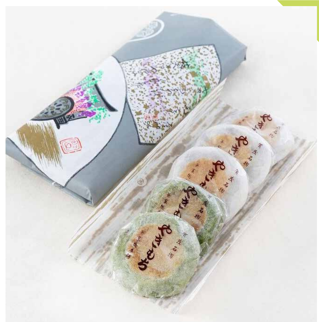
5.29 葵家やきもち総本舗 ◆ やきもち (1包/白3個・よもぎ2個入) ……………675円 [水]