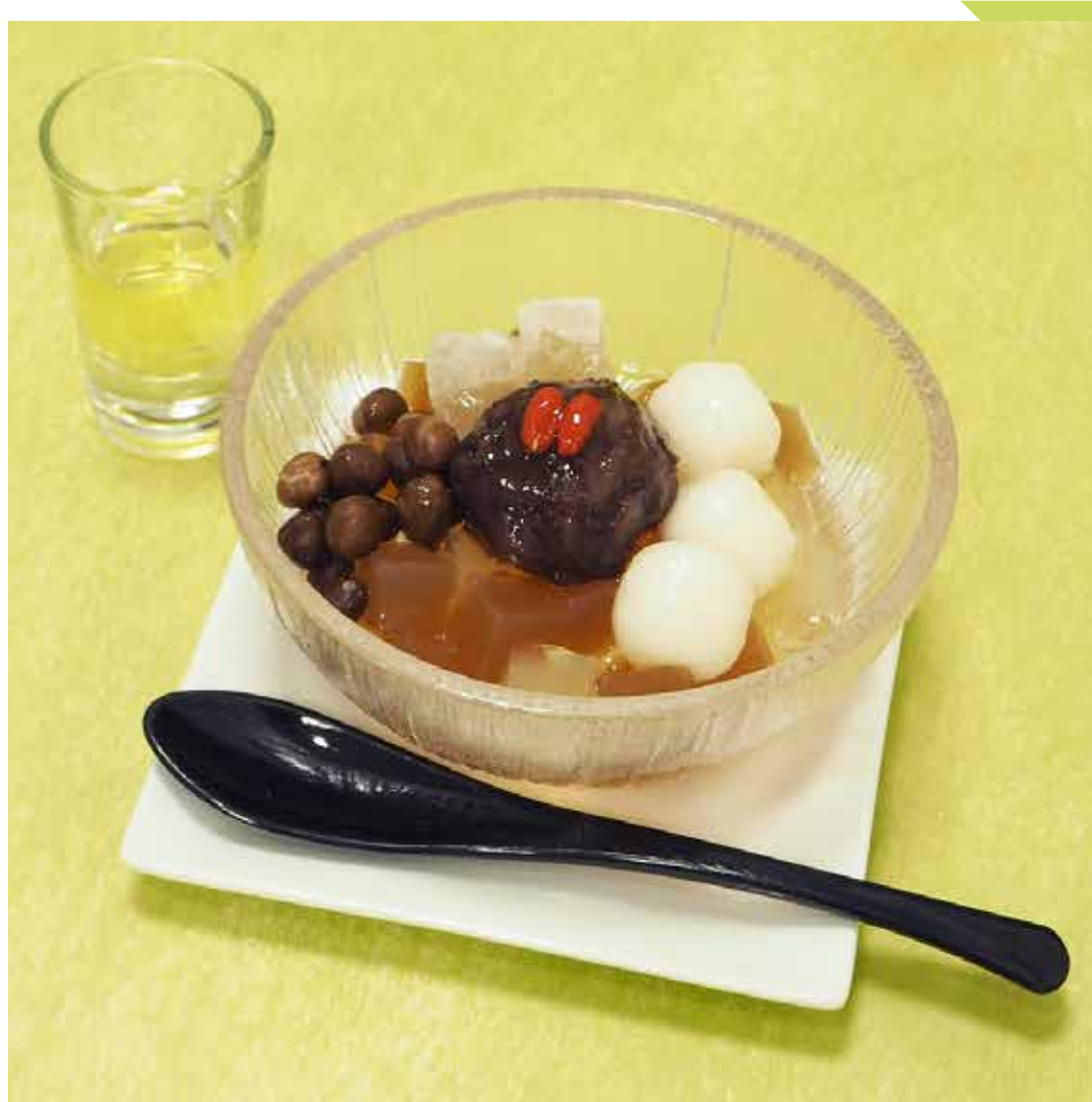
5.25 船橋屋 ◆ 大納言ほうじ茶あんみつ (1個) ……………651円 [土]