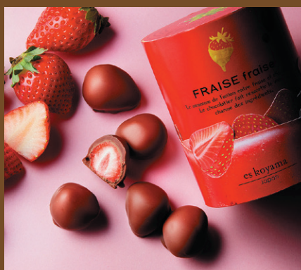
《パティシエ エス コヤマ》 フレーズ フレーズ(10個入) 1,836円