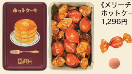
《メリーチョコレート はじけるキャンディチョコレート。》 ホットケーキ缶(9個入) 1,296円