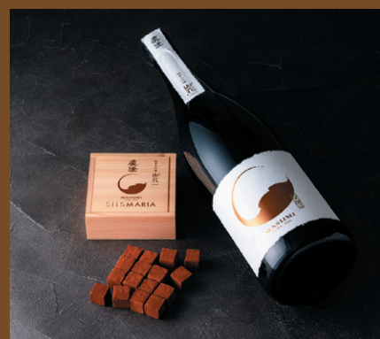
《シルスマリア》 真澄生チョコレート(16粒入) 2,592円