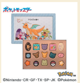
《マイネローレン ポケモンデザイン》 チョコセットL(ポケモン) (15個入) 2,376円