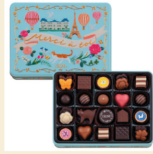
《かりゅう by モロゾフ》 かりゅう (24個入) 1,728円