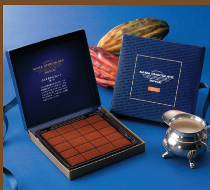
《ロイズ》 生チョコレート[オーレ](20粒入) 864円