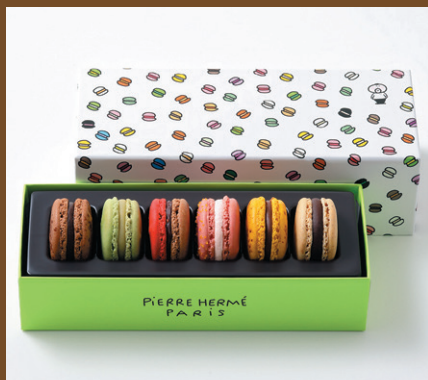
《ピエール・エルメ・パリ》 マカロン6個詰合せ(1箱) 3,240円