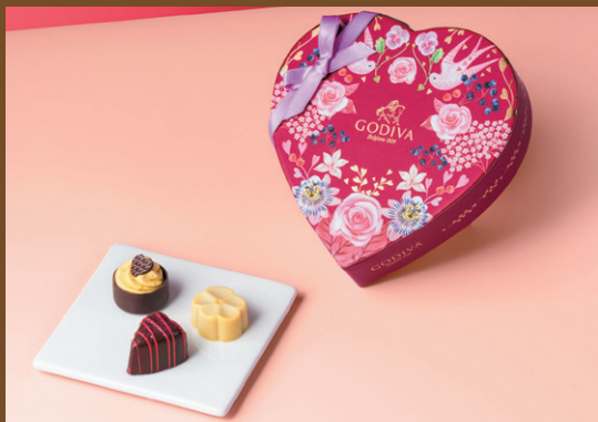
《ゴディバ》 ブーケド ゴディバ セレクション(6粒入) 3,942円