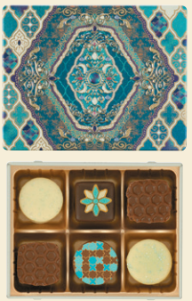
《メリーチョコレート ジャミーラ》パフル(海) (6個入) 1,512円