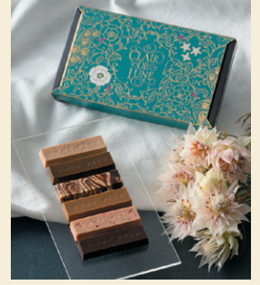
《神戸風月堂》 コウベピアール (6本入、1箱) 1,296円