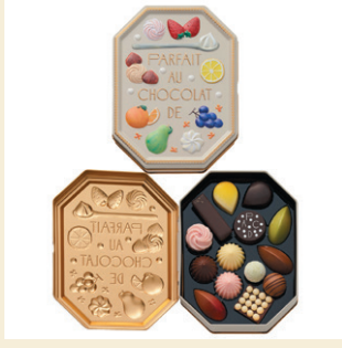
《パフェをショコラで。》 パフェをショコラで。 (14個入) 2,376円