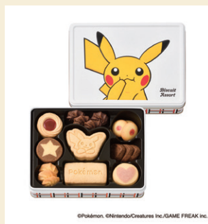
《ユーハイム (ポケモン)》 ビスケットアソート (110g) 2,160円