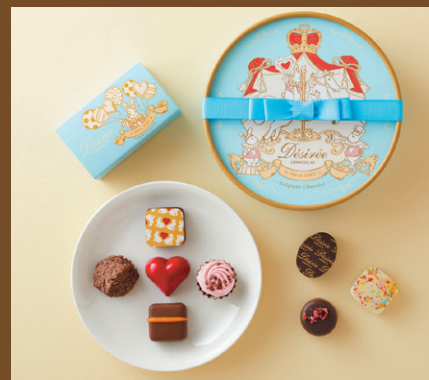
《デジレー》 そごう・西武限定ショコラ(8個入) 2,187円