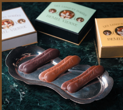
《デメル》ソリッドチョコ猫ラベル [[ミルク・ヘーゼルナッツ・スイート]、各1箱] 2,268円