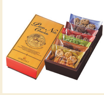
《グランプラス》ペカンナッツ ショコラ シーズナルアソート (6袋入、1箱) 1,998円