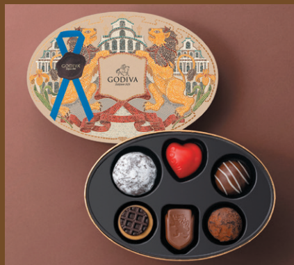
《ゴディバ》 ベルギースイーツ アソートメント(6粒入) 3,564円