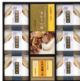
C208-722(KSD-30A) ★ 無限堂 稲庭曲げ餛飩と2種のつゆ 稲庭曲げうどん70g×6、カレーつゆ100g×2、比内地鶏つゆ30ml×4