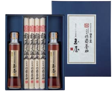
C261-705(YK50N) 八代目 佐藤養助 稲庭干温飩・しろだしつゆ詰合せ うどん100g×8、白だしつゆ200ml×2