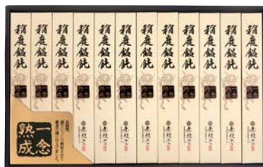
C208-719(OCM-40) ★ 無限堂 稲庭鯉飩「一念熟成」 稲庭うどん80g×12