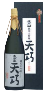
C203-703(天巧) 太平山 純米大吟醸 天巧1.8ℓ 純米大吟醸1.8ℓ