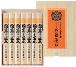
C261-712(MYS30) ★ 八代目 佐藤養助 稲庭干温飩 うどん80g×7