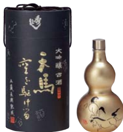
C203-712 秀よし 大吟醸 金瓢天馬空を駆ける 大吟醸720ml