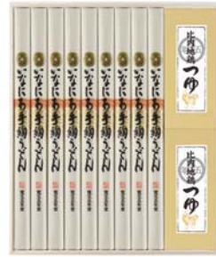
C218-711(RZ-50) ★ 寛文五年堂 いなにわ手絢うどん・比内地鶏つゆ詰合せ いなにわ手絢うどん100g×9、比内地鶏つゆ120ml×2