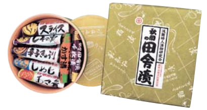
C230-701(B-30) 浅舞婦人漬物職人 秋田の田舎漬 樽入 7種セット 千枚漬110g、粕漬スライス140g、しその実120g、味噌漬スライス140g、辛子きゅうり120g、酢漬あさ舞120g、しめじ90g