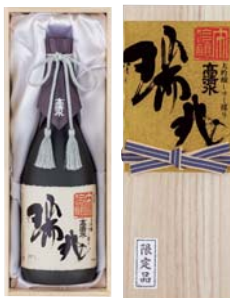
C204-702(M-DZ) 高清水 大吟醸 しずく採り瑞兆 大吟醸しずく採り瑞兆 720ml