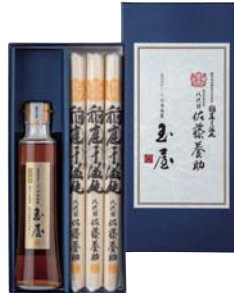
C261-704(YK30N) 八代目 佐藤養助 稲庭干温飩・しろだしつゆ詰合せ うどん80g×5、白だしつゆ200ml×1