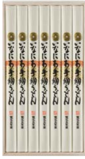
C218-701(UTR-30) ★ 寛文五年堂 いなにわ手絢うどん いなにわ手絢うどん100g×7