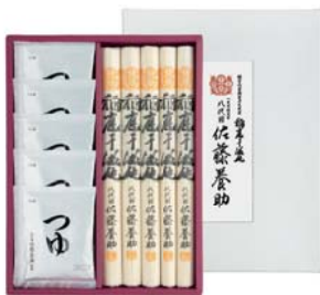
C261-701(WY30N) 八代目 佐藤養助 稲庭干温飩詰合せ うどん80g×5、醤油つゆ(アルミパック入80g×5袋)