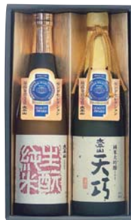
C203-701(SG-40) 太平山 彩月セット 生酛純米、純米大吟醸 各720ml