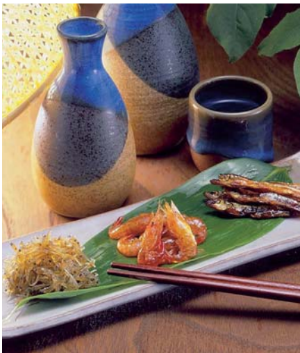
C232-702(M40) 安田のつくだ煮 詰合せ いかあられ50g、わかさぎ50g、胡桃フィッシュ50g、ちりめん50g、こえび50g、子持ちわかさぎ50g 【賞味期限:常温60日】