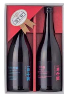
C203-718 一滴千両 大吟醸のみくらべ 一滴千両大吟醸、純米大吟醸 各720ml