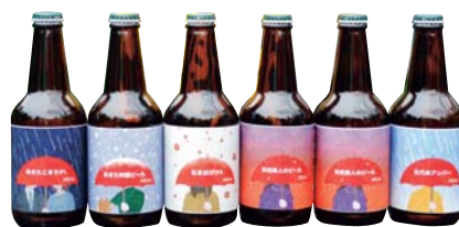
F206-703(SC) 秋田あくらビール 受賞BEER&ギフトセット あきたこまちIPL×1、あきた吟醸ビール×1、なまはげIPA×1、 秋田美人のビール×2、古代米アンバー×1 各330ml