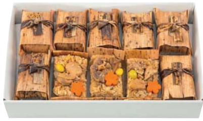
F207-705(OH-10) 秋田味商 比内地鶏おこわ おこわ100g×10 【賞味期限:冷凍60日 解凍後冷蔵2日】