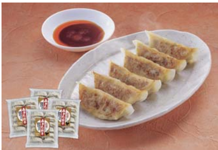
F208-711(GG-4) 無限堂 田沼屋慶吉 あきた餃子詰合せ あきた餃子(25g×12入)×4袋 【賞味期限:冷凍180日】お届け期間:11月中旬～12月下旬