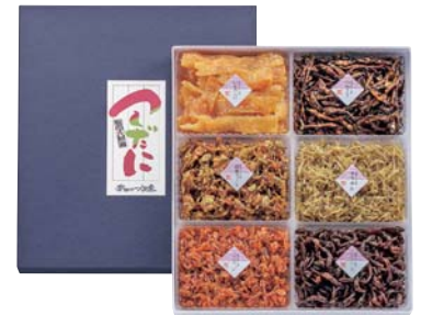
C232-701(M50) 安田のつくだ煮 詰合せ いかあられ100g、わかさぎ80g、胡桃フィッシュ90g、ちりめん80g、こえび90g、こごり80g 【賞味期限:常温60日】