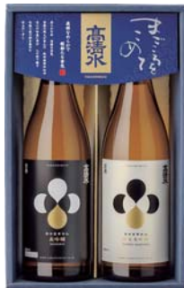
C204-708(TJD-B) 高清水 大吟醸・純米大吟醸セット 大吟醸、純米大吟醸 各720ml