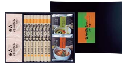
C261-703(GR-45) 八代目 佐藤養助 稲庭干温飩 つゆ・カレー2種詰合せ うどん80g×8、醤油つゆ(アルミパック入80g×3袋)×2、グリーンカレー180g×1、レッドカレー180g×1