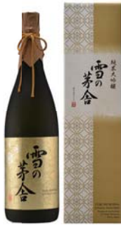
C202-704 雪の茅舎 純米大吟醸1.8ℓ 純米大吟醸1.8ℓ