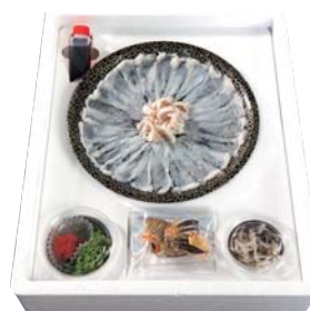
F235-701(AMK1) 秋田まるごと加工 北限のとらふぐ刺身セット 天然とらふぐ刺身50g、天然とらふぐ皮30g、ポン酢30g、天然とらふぐ身皮15g、薬味10g、焼きとらふぐヒレ3g 【消費期限:冷蔵4日】 承り終了日:12月16日(月)、お届け期間:12月28日(土)まで