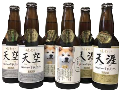
F206-707 湖畔の杜ビール 全国酒類コンクール 第1位選りすぐりビールセット 味わい天空®、秋田犬BEER、味わい天涯® 各330ml×2