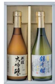
C202-712 川穂 大吟醸のみくらべ 大吟醸、純米大吟醸 各720ml