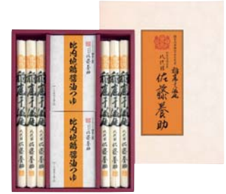
C261-706(HY-30) 八代目 佐藤養助 稲庭干温飩 比内地鶏醤油つゆ詰合せ うどん80g×6、比内地鶏醤油つゆ(アルミパック入40g×3袋)×2