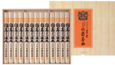
C261-713(MYS50) ★ 八代目 佐藤養助 稲庭干温飩 うどん80g×13