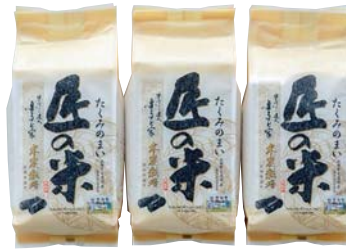
C212-703(こまち匠3) 大湯村 こまちファームリー 匠の米1.5kgセット 匠の米あきたこまち1.5kg×3