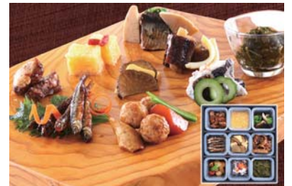
F208-715(HM-54) 無限堂 田沼屋慶吉 秋田の味「百味蔵」 ぎばさ120g、比内地鶏の玉子寒天120g、豚軟骨煮70g、比内地鶏団子と根野菜のあんかけ70g、はたはた寿し70g、かすべ煮40g、いふりがこチーズ40g、わかさぎ甘露煮25g 【賞味期限:冷凍60日 解凍後冷蔵3日】 お届け期間:11月中旬～12月下旬