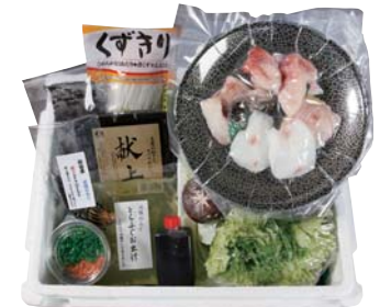
F235-702(AMK10) 秋田まるごと加工 北限のとらふぐ鍋セット 豆腐400g、野菜(白菜、水菜、しいたけ)400g、天然とらふぐ350g、ふぐだし200g、くずきり90g、自家製ぼん酢70g、薬味10g、昆布3g、焼きとらふぐヒレ3g 【消費期限:冷蔵4日】 承り終了日:12月16日(月)、お届け期間:12月28日(土)まで