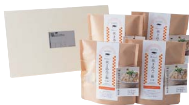
C235-705(AMK4) 秋田まるごと加工 秋田ふぐ炊き込みご飯の素セット 秋田ふぐ炊き込みご飯の素210g×4 【賞味期限:常温180日】