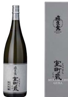
C201-705 飛良泉 純米吟醸 室町蔵 純米吟醸1.8ℓ