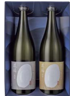
C203-709 爛漫 純米大吟醸 環稻セット 純米大吟醸百田、純米大吟醸一穂積 各720ml