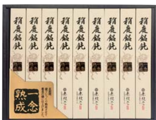
C208-718(OCM-30A) ★ 無限堂 稲庭鯉飩「一念熟成」 稲庭うどん80g×9