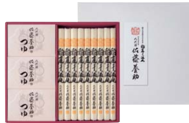
C261-702(WY50N) 八代目 佐藤養助 稲庭干温飩詰合せ うどん80g×9、醤油つゆ(アルミパック入80g×3袋)×3