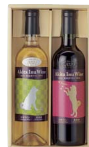
C206-702 小坂七滝ワイナリー 秋田犬ワインのみくらベセット 秋田犬ワイン赤、秋田犬ワイン白 各720ml