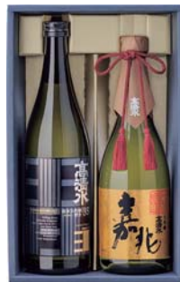
C204-706(TIR-B) 高清水 彩セット 純米大吟醸蔵付酵母仕込み磨き35、大吟醸嘉兆 各720ml