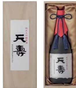
C203-720 天寿 純米大吟醸 零酒 純米大吟醸720ml