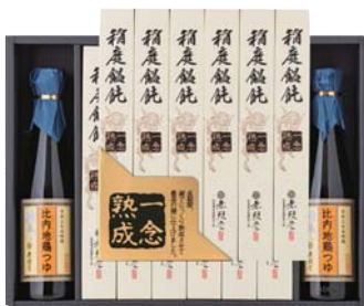
C218-721(OCH-50A) ★ 無限堂 稲庭餛飩「一念熟成」比内地鶏つゆ付 稲庭うどん80g×12、比内地鶏瓶つゆ300ml×2