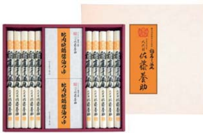
C261-707(HY-50) 八代目 佐藤養助 稲庭干温飩 比内地鶏醤油つゆ詰合せ うどん80g×10、比内地鶏醤油つゆ(アルミパック入40g×5袋)×2