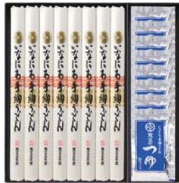
C218-713(TU-40) ★ 寛文五年堂 いなにわ手絢うどん・つゆ詰合せ いなにわ手絢うどん80g、寛文のつゆ(濃縮3倍)30ml 各8袋