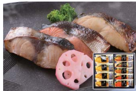
F208-713(BTS-50) 無限堂 田沼屋慶吉 秋田県産吟醸漬詰合せ 真たら味噌漬×4切、ぶり味噌漬×3切、さけ味噌漬×2切 【賞味期限:冷凍60日 解凍後冷蔵3日】 お届け期間:11月中旬～12月下旬