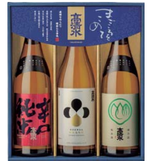
C204-707(TMN-B) 高清水 まごころセット 辛口酒、純米大吟醸、純米酒 各720ml