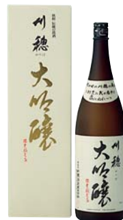
C202-709(大吟醸) 川穂 大吟醸 大吟醸1.8ℓ