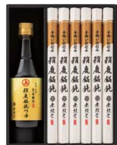
C208-723(MA-30B) ★ 無限堂 無限堂×安藤醸造 稲庭餛飩つゆ詰合せ 稲庭うどん90g×6、稲庭うどんつゆ360ml