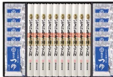
C218-714(TU-50) ★ 寛文五年堂 いなにわ手絢うどん・つゆ詰合せ いなにわ手絢うどん80g、寛文のつゆ(濃縮3倍)30ml 各10袋