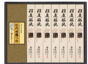
C208-720(OCH-30A) ★ 無限堂 稲庭鯉飩「一念熟成」比内地鶏つゆ付 稲庭うどん80g×7、比内地鶏つゆ30ml×7