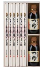
C218-715(WSA-50T) ★ 寛文五年堂 いなにわ手絢うどん・つゆ詰合せ いなにわ手絢うどん140g×6、寛文のつゆ(ストレート)295ml×2