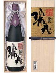
C204-701(L-DZ) 高清水 大吟醸 しずく採り瑞兆 大吟醸しずく採り瑞兆 1.8ℓ