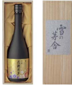
C202-702 雪の茅舎 大吟醸 花朝月夕720ml 大吟醸720ml

湧き出る伏流水 厳選した米 一世紀を経た仕込み蔵の中 選びぬかれた酵母が醸す 加えない 除かない 自然のままに