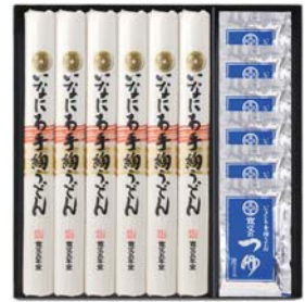
C218-712(TU-30) ★ 寛文五年堂 いなにわ手絢うどん・つゆ詰合せ いなにわ手絢うどん80g、寛文のつゆ(濃縮3倍)30ml 各6袋