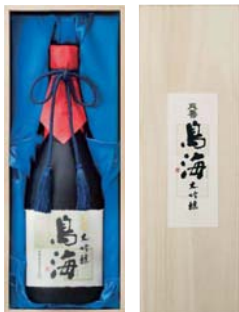
C203-708 天寿 大吟醸 鳥海 大吟醸720ml