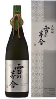
C202-703(G-45) 雪の茅舎 大吟醸1.8ℓ 大吟醸1.8ℓ