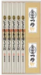
C218-710(RZ-30) ★ 寛文五年堂 いなにわ手絢うどん・比内地鶏つゆ詰合せ いなにわ手絢うどん100g×5、比内地鶏つゆ120ml×2